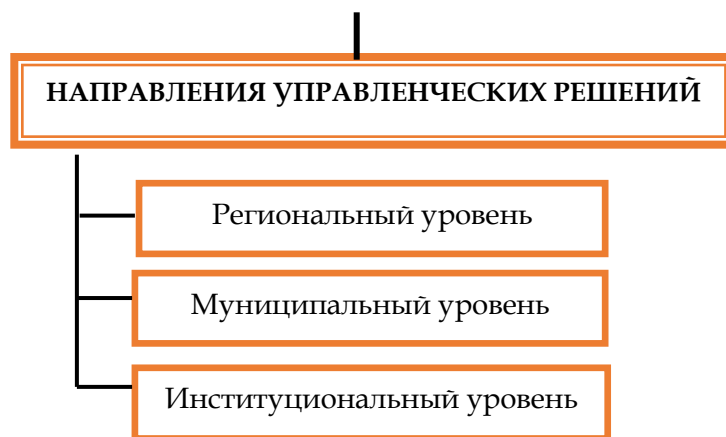
Рисунок 2. Структура региональной модели оценки качества общего образования

Обобщенная характеристика региональной модели оценки качества общего образования представлена в приложении 1.